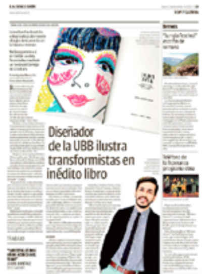
DIARIO LA DISCUSIÓN. CHILLÁN DICIEMBRE 2015