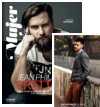
REVISTA MUJER. LA TERCERA JUNIO 2015