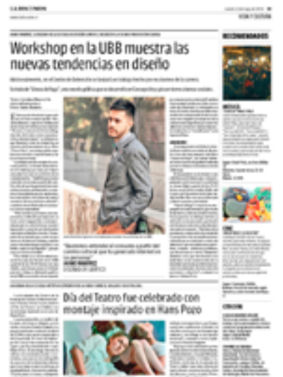
DIARIO LA DISCUSIÓN. CHILLÁN MAYO 2016