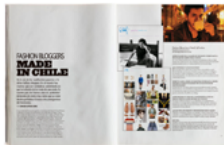
REVISTA ED. SEPTIEMBRE 2012