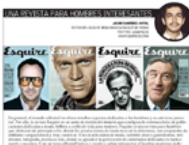
VIDA ACTUAL. EL MERCURIO JULIO 2012