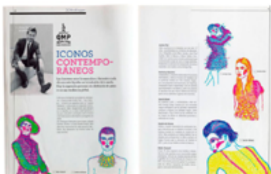
REVISTA ZONA. MARZO 2015