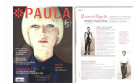
REVISTA PAULA. MARZO 2012